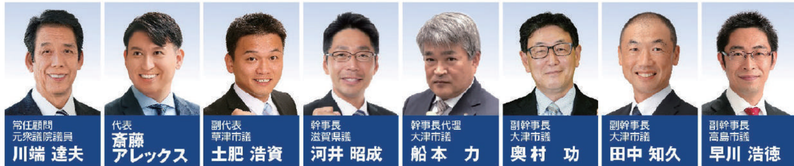
常任顧問 元衆議院議員 川端 達夫