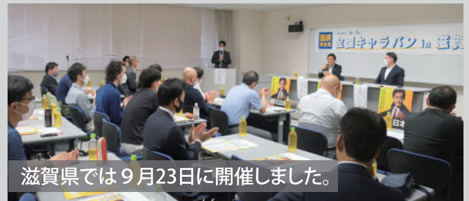
滋賀県では9月23日に開催しました。