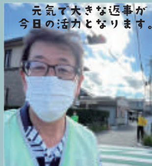
元気で大きな返事が今日の活力となります。