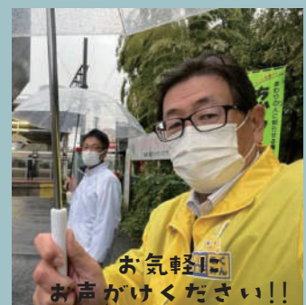
お気軽にお声がけください!!